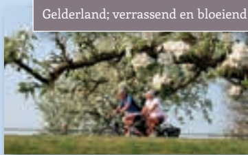
Gelderland; verrassend en bloeiend!