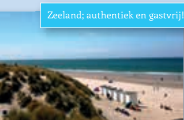
Zeeland; authentiek en gastvrij!