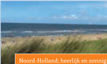
Noord-Holland; heerlijk en zonnig!