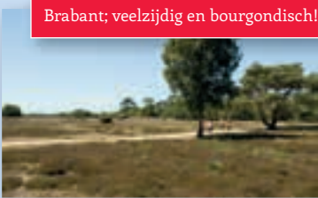
Brabant; veelzijdig en bourgondisch!