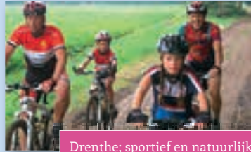
Drenthe; sportief en natuurlijk!