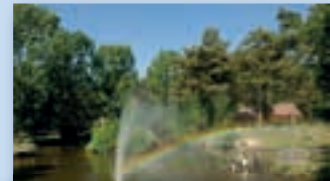
Limburg; onvergetelijk en mooi!