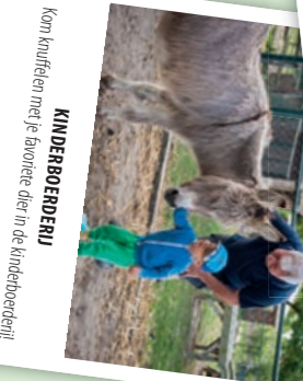
KINDERBOENDERIJ Kan knuffelen met je favoriete dier in de kinderbouderij!