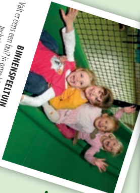
BINNENSPEELTIJN Vallt er eens een bui? In onze binnenspeeltuin en op de technische vermaak je wel!