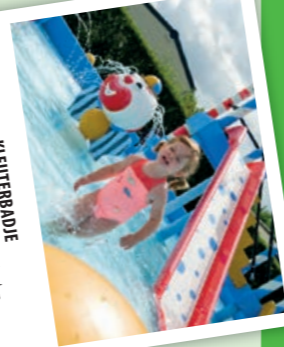
KLUTERBADJE De allerkleinsten kunnen lekker afkoelen en spelen in ons kluterbaddi!