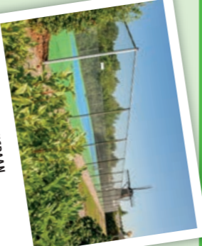
TENNISBAAN De tennisbaan is voor campinggasten of als te gebruiken.