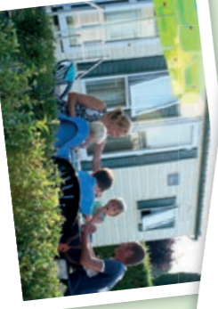
HUURCHALET (Geen tent of caravan!) Vraag naar onze verhuuraccommodatie.