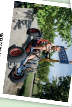
SKELTERBAAN Populair bij jong en oud: onze skelterbaan!