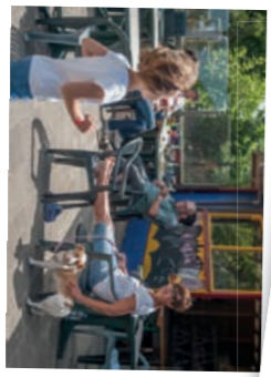
FRITURUW/TERRAS Sinds 2018 hebben we bij Prewiellet een nieuwe frituur ingebouwd. Kom lekker wat eten en drinken op ons vernieuwde terras.