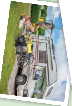
CAMPVRIJLAIZEN Voor de groeiende groep campers hebben we verhuurde campervrijlansen, evenwel ook met privékampeerplaatsen.